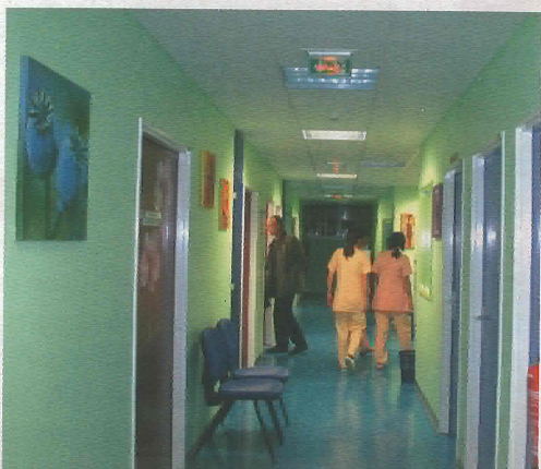
Centre d'orthogénie : un couloir coloré et chaleureux